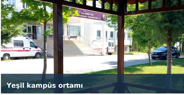
Yeşil kampüs ortamı

Ferah iç mekânlar, sosyal alanlar ve spor olanaklarıyla öğrencilerin akademik gelişimini destekleyen güvenli ve düzenli bir okul ortamı sunulur.