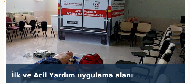
İlk ve Acil Yardım uygulama alanı