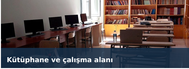
Kütüphane ve çalışma alanı

Kovancılar Meslek Yüksekokulu, 2010 yılında kurulmuş; 2010-2011 öğretim yılında eğitim-öğretime başlamıştır. 2013-2014 güz döneminden itibaren yeni binasında hizmet vermeye başlayan okul; 6450 m 2 kapalı alan, 18 derslik ve 1500 öğrenci kapasitesine sahip bir eğitim ortamı sunar.